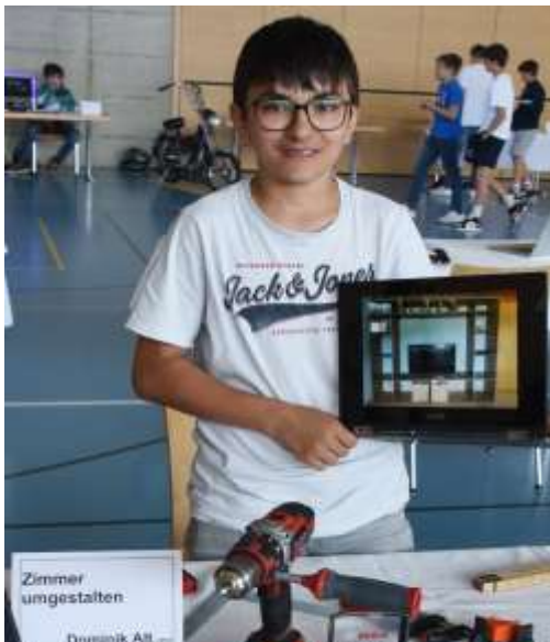
Dominik Alt Zimmer umgestalten