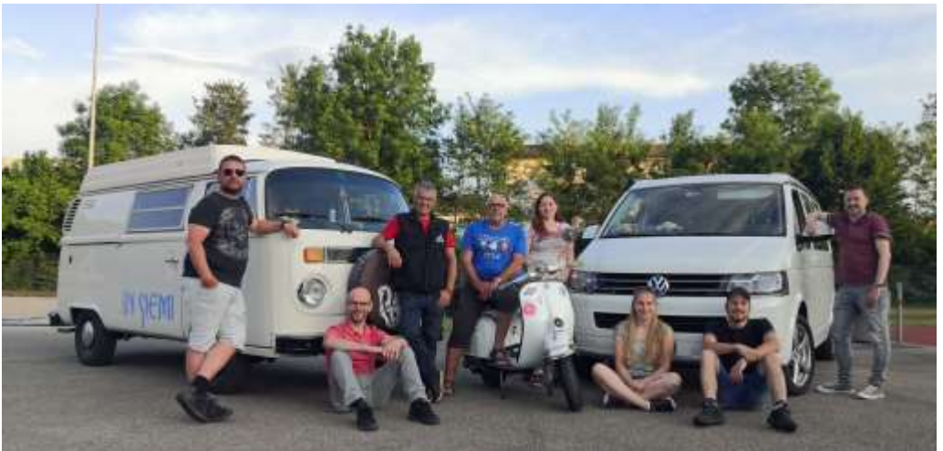
Das OK des 1. VW Bus & Vespatreffen Zell