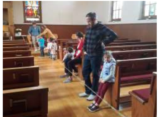
Foto dem Gemeindeleben

Beim Fiire mit de Chliine wurde gemeinsam eine grosse Kordel gedreht.