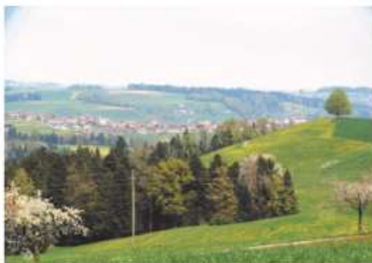
Blick vom Hilferdingerberg ins Dorf