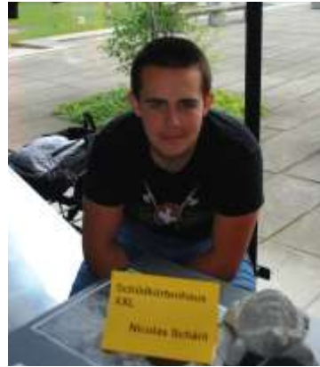
Nicolas Schärli: Schildkrötchenhaus XXL