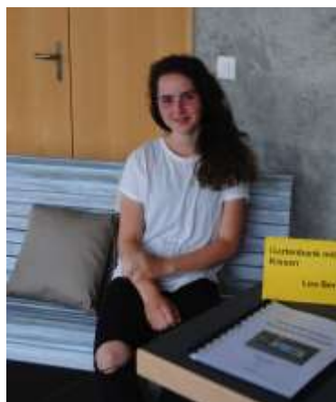
Lea Bernet: Gartenbank mit Kissen

Text und Bilder: Michael Bieri / Peter Flückiger, Sekundarschule Zell