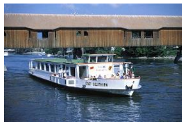
Büren an der Aare

Rückkehr: ca. 18.30 Uhr Kosten: ca. Fr. 90.- für Car, Schifffahrt inkl. Mittagessen; Annullierungskosten pro Teilnehmerin ab 3 Tage vor der Reise Fr. 20.-