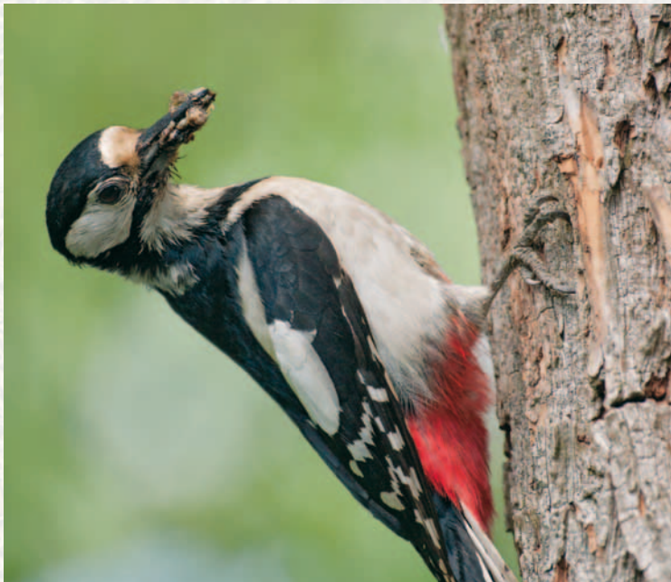
Buntspechte verspeisen gerne Ameisen.

Die Hügel bauende Rote Waldameise gehört zu den auf-fälligsten und faszinierendsten Insekten im Wald. Die Vernetzung der Waldameisen mit zahlreichen Tier- und Pflanzenarten ist vielfältig: