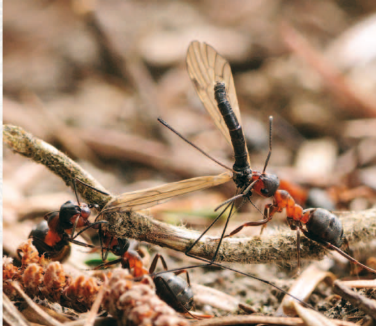
Rote Ameisen auf der Jagd.

Wussten Sie , dass sich die Ameisen zu fast zwei Drittel von Honigtau und zu einem Drittel von Insekten ernähren?