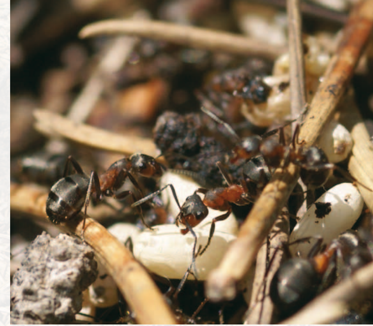
Ameisen mit Larven.

Wussten Sie , dass sich die Ameisen im Frühjahr auf der Kuppel ihres Nestes sonnen, um danach die «getankte» Wärme ins Nest zu tragen, damit auch die Kolleginnen in den tieferen Schichten geweckt werden?